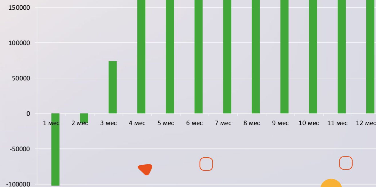
График роста чистой прибыли детского сада «Под солнышком» открытого по франшизе

Система привлечения клиентов в детский сад «Под солнышком» позволяет получить прогнозируемую прибыль с первого месяца и окупить вложения уже к 6 месяцу.